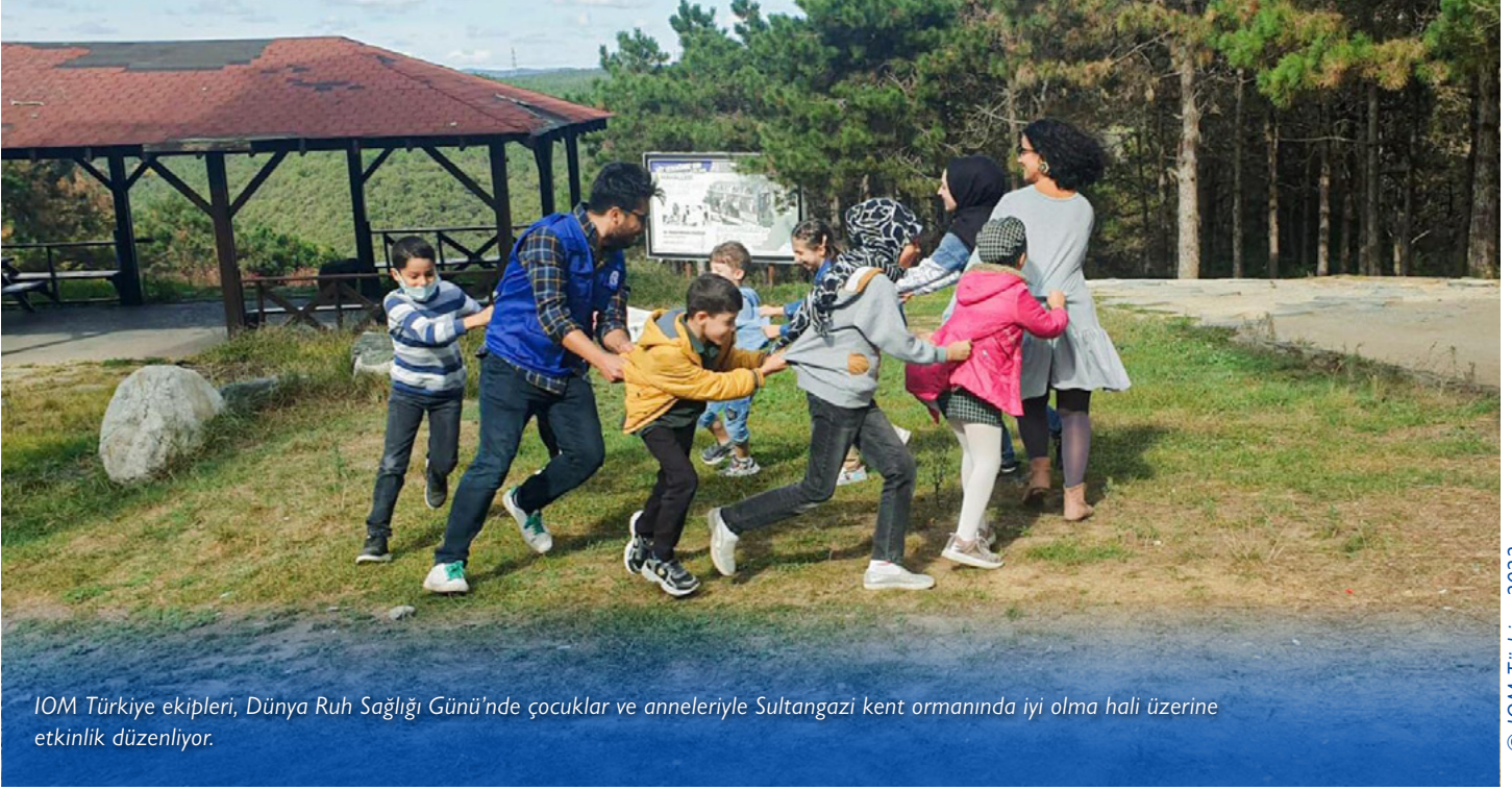
IOM Türkiye ekipleri, Dünya Ruh Sağlığı Günü'nde çocuklar ve anneleriyle Sultangazi kent ormanında iyi olma hali üzerine etkinlik düzenliyor.