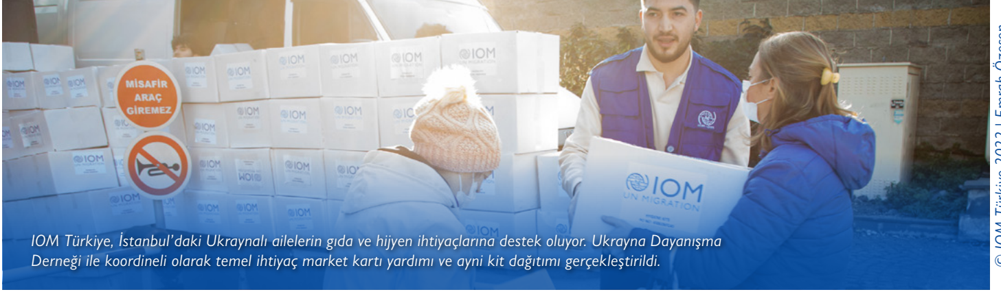
IOM Türkiye, İstanbul'daki Ukraynalı ailelerin gıda ve hijyen ihtiyaçlarına destek oluyor. Ukrayna Dayanışma Derneği ile koordineli olarak temel ihtiyaç market kartı yardımı ve aynı kit dağıtımı gerçekleştirildi.