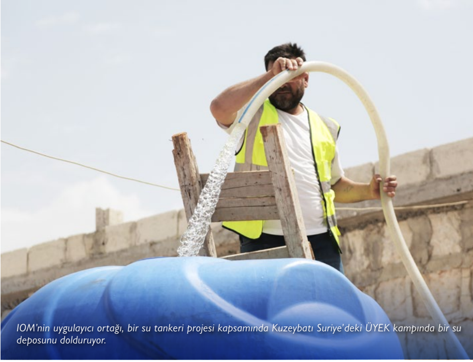
IOM'nin uygulayıcı ortağı, bir su tankeri projesi kapsamında Kuzeybatı Suriye'deki ÜYEK kampında bir su deposunu dolduruyor.