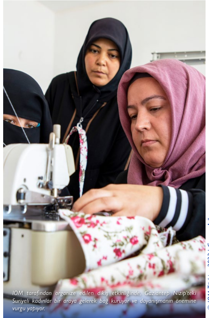
IOM tarafından organize edilen dikiş etkinliğinde, Gaziantep Nizip'teki Suriyeli kadınlar bir araya gelerek bağ kuruyor ve dayanışmanın önemine vurgu yapıyor.

IOM, Aydın, Hatay, İstanbul, İzmir, Kırklareli ve Malatya'da depremden etkilenen ve yerinden edilen 12.388 aileye gıda kolileri dağıtarak yardımda bulundu. Ayrıca IOM, Şanlıurfa Belediyesi ile iş birliği yaparak bölgede 1.000 kişiye günde üç öğün hizmet veren mobil aşevi kurdu. Öte yandan gerekli ekipman ve pişirme araçlarını sağlanarak Kahramanmaraş'ın Elbistan ilçesinde bir aşevi kurulmasına destek verildi.