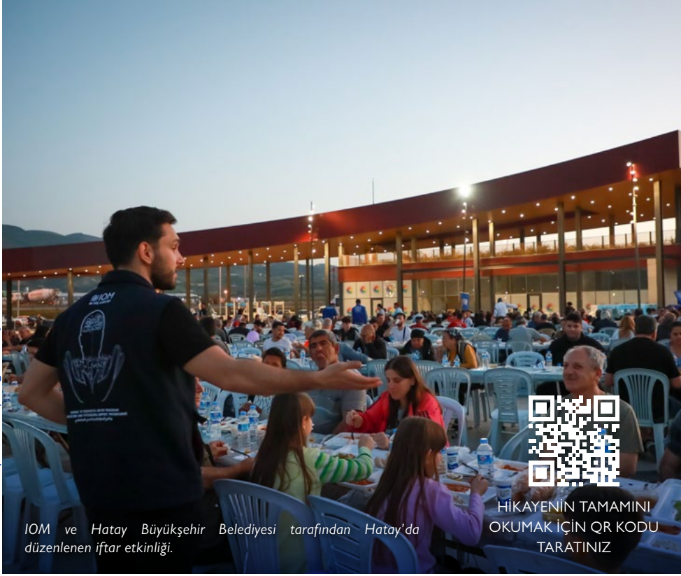
IOM ve Hatay Büyükşehir Belediyesi tarafından Hatay'da düzenlenen iftar etkinliği.

HİKAYENİN TAMAMINI OKUMAK İÇİN QR KODU TARATINIZ