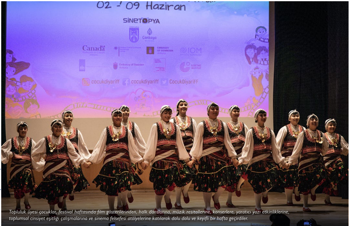
Topluluk üyesi çocuklar, festival haftasında film gösterilerinden, halk danslarına, müzik resitallerine, konserlere, yaratıcı yazı etkinliklerine, toplumsal cinsiyet eşitliği çalışmalarına ve sinema felsefi atölyelerine katılarak dolu dolu ve keyifli bir hafta geçirdiler.

Belediye Toplum ve Göçmen Merkezleri (BTGM), buldukları şehirlerde depremzedeler dahil olmak üzere herkese, danışmanlık vermeye ve sosyo-kültürel aktiviteler düzenlemeye devam ettiler. Yerel yönetimlerle koordinasyon halinde, deprem sonrası sosyal uyumu teşvik etmek için 7.000 göçmen, mülteci ve yerel topluluktan kişiyi bir araya getiren iftar etkinlikleri düzenlendi. Adana'da, Adana Büyükşehir Belediyesi ve BTGM çocuklar için bir festival düzenledi, ayrıca kadınlara yönelik çilek toplama ve seramik yapımı aktiviteleri organize edildi. Nisan ayında kutlanan Çocuk Bayramı kapsamında, BTGM'ler aracılığıyla, çocuklar ve aileleri için Adana, Gaziantep, Ankara ve Şanlıurfa'da çeşitli etkinlikler düzenlendi. IOM, Keçiören (Ankara) BTGM, Sinematopya Sinema Gönüllüleri Derneği ile ortaklaşa Çocukların Diyarı Film ve Sanat Festivali'ni düzenledi. Ek olarak, Mersin ve Kilis'teki merkezler, personellere ve paydaşlara yönelik kapasite geliştirme faaliyetlerine odaklandılar. Mersin BTGM engelli bireylerin dahiliyeti ve çocuk koruma konularında paydaşlara yönelik eğitimler düzenlerken Kilis BTGM personele yönelik bilgilendirme oturumlarına odaklandı.