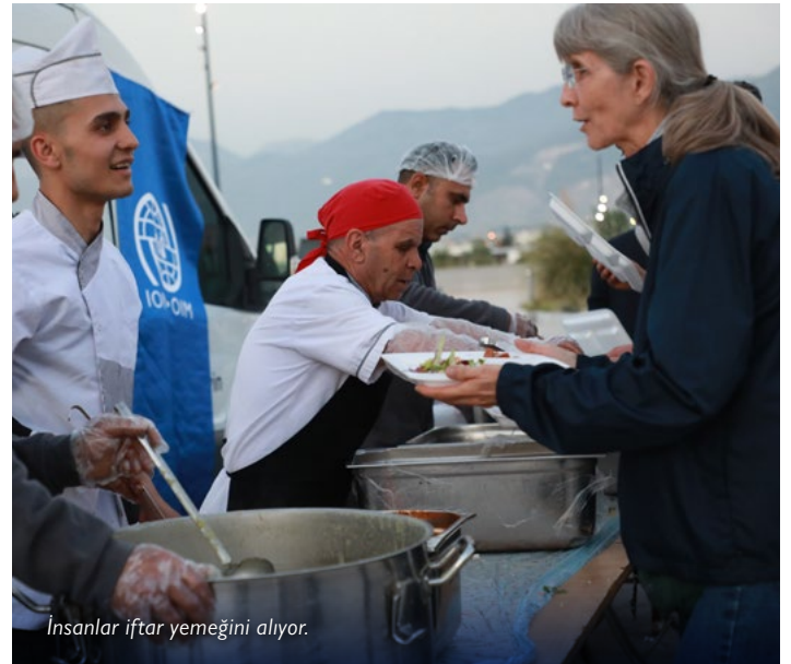
İnsanlar iftar yemeğini alıyor.