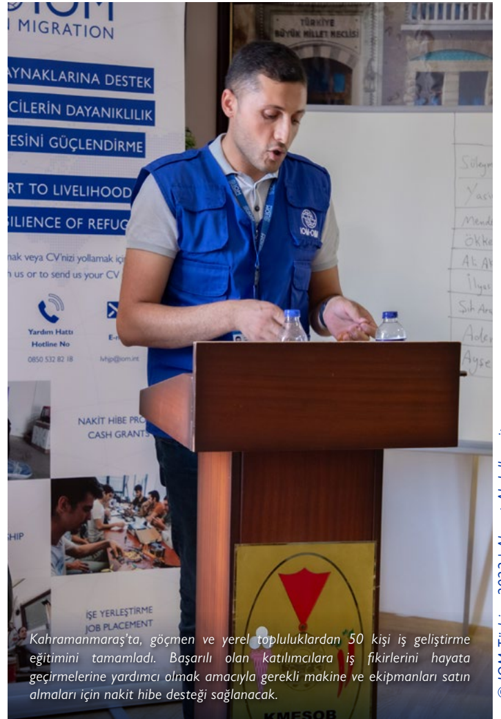
Kahramanmaraş'ta, göçmen ve yerel topluluklardan 50 kişi iş geliştirme eğitimini tamamladı. Başarılı olan katılımcılara iş fikirlerini hayata geçirmelerine yardımcı olmak amacıyla gerekli makine ve ekipmanları satın almaları için nakit hibe desteđi sağlanacak.

IOM, Antalya ili genelinde ihtiyaç sahibi 1.800 kişiye gıda kolisi dağıtarak insani yardım çabalarını genişletti.