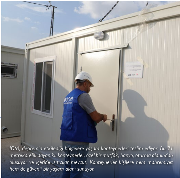
IOM, depremin etkilediđi bölgelere yaşam konteynerleri teslim ediyor. Bu 21 metrekairelik dayanıklı konteynerler, özel bir mutfak, banyo, oturma alanından oluşuyor ve içeride ısıtıcılar mevcut. Konteynerler kişilere hem mahremiyet hem de güvenli bir yaşam alanı sunuyor.

IOM, savunmasız aileleri kendi ayakları üzerinde durma yolunda güçlendirmek için, onların özel ihtiyaçlarına ve becerilerine göre hazırlanmış aynı hibeler sunarak etkin adımlar attı ve böylece gelir getirici girişimleri teşvik etti. Bu stratejik yaklaşım, faydalanıcıların kendine özgü yetenekleri ve istekleriyle uyumlu olarak küçük işletme girişimlerini teşvik etmek için tasarlandı. Bu program kapsamında Adıyaman'da 7 kişiye destek verildi. Ek olarak, toplum istikrarı desteđinin bir parçası olarak IOM, Göç ve Dirençli Şehirler - Uluslararası Yaz Akademisi organizasyonunu destekledi, Antalya ilindeki bir kuruluşa su filtreleme sistemi sağladı ve Adana, Antalya, Gaziantep ve İzmir'deki 1.300 öğrenciyi çeşitli kırtasiye malzemeleriyle destek verdi.