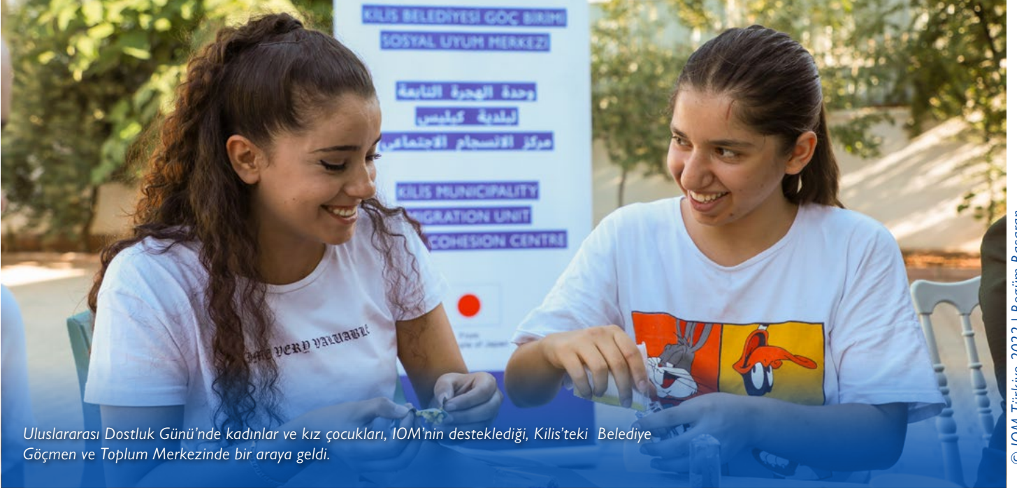
Uluslararası Dostluk Günü'nde kadınlar ve kız çocukları, IOM'nin desteklediği, Kilis'teki Belediye Göçmen ve Toplum Merkezinde bir araya geldi.