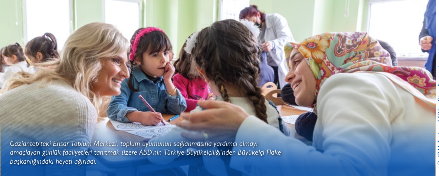
Gaziantep'teki Ensar Toplum Merkezi, toplum uyumunun sağlanmasına yardımcı olmayı amaçlayan günlük faaliyetleri tanıtmak üzere ABD'nin Türkiye Büyükelçiliği'nden Büyükelçi Flake başkanlığındaki heyeti ağırladı.